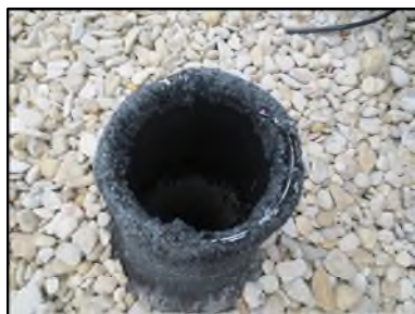
Photo N° 346 AMIANTE CIMENT -- TOITURE TERRASSE Toiture Ventilation haute (Fibres-ciment)

Dossier n°: 2013-09-300 FK DTA PC-21LAF-OPH